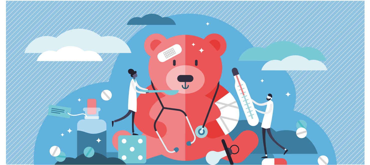
Charte Européenne des Droits de l'Enfant Hospitalisé adoptée par le Parlement Européen le 13 mai 1986.

1 L'admission à l'hôpital d'un enfant ne doit être réalisée que si les soins nécessités par sa maladie ne peuvent être prodigués à la maison, en consultation externe ou en hôpital de jour.