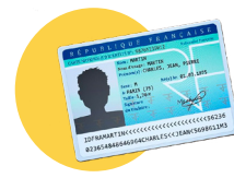
● Votre pièce d'identité