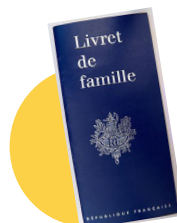
● Le livret de famille (en cas de prise en charge de votre enfant)

Ce livret vous présente de façon chronologique toutes les étapes du parcours de soins au sein de notre établissement. Nous vous remercions d'en prendre connaissance et de le conserver avec vous. Vous trouverez à la fin de ce livret un rabat au sein duquel vous pourrez intégrer les documents qui vous sont remis. Vous trouverez en annexe à la fin du livret les documents ci-dessous :