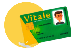
● Votre carte vitale