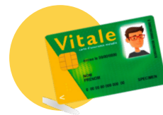
● Votre carte vitale