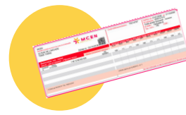
● Votre carte de mutuelle