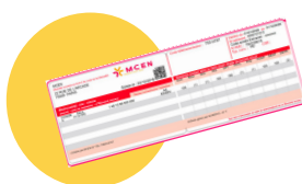
● Votre carte de mutuelle