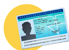
● Votre pièce d'identité